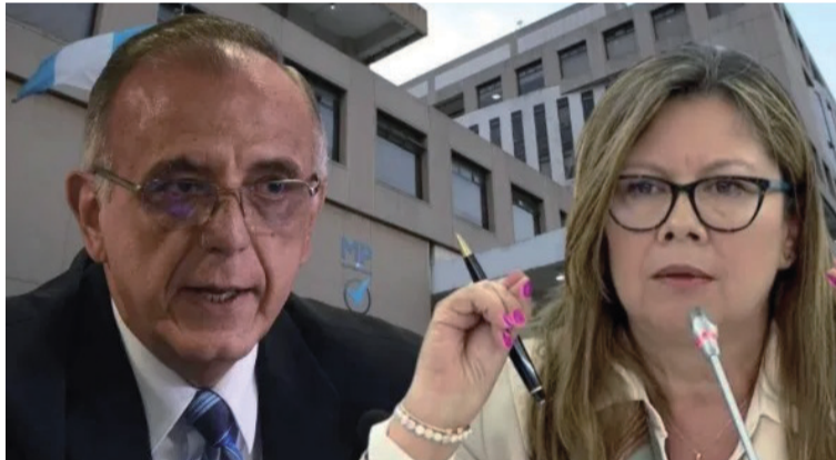
Se emitió una alerta internacional a través de Interpol para facilitar su aprehensión en cualquier país.

La Fiscalía guatemalteca acusa a ambos colombianos de delitos como asociación ilícita, obstrucción de justicia, tráfico de influencias y colusión en relación con el caso