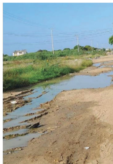
El feto fue hallado cerca al mercado de Riohacha.

Asimismo, se conoció que las autoridades iniciaron las investigaciones para determinar el móvil de este hecho y establecer la identidad de la madre del menor.