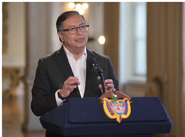
Petro reiteró que detrás de estos planes estaría lo que denominó la 'Junta del Narcotráfico con sede en Abu Dhabi'.

A través de una publicación en su cuenta de X, el mandatario indicó que el pasado 20 de julio habría sido la fecha clave del atentado frustrado, presuntamente alertado por la Embajada de Estados Unidos, el cual iba a ser ejecutado por francotiradores profesionales.