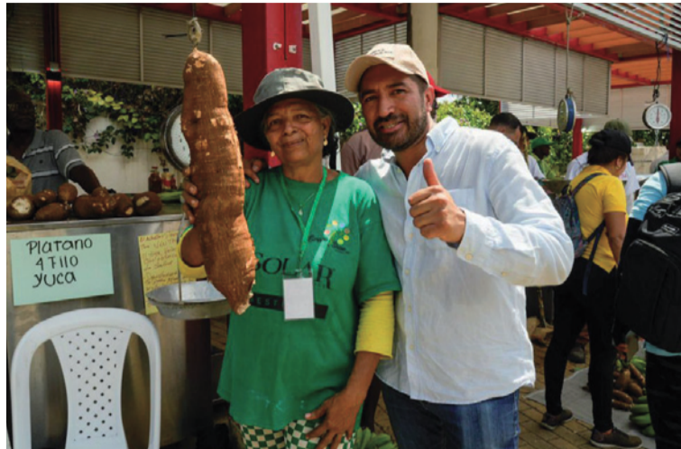
La meta es realizar ruedas de negocios en cada departamento del país, alcanzando las 32 regiones.

En lo corrido de 2025, se han celebrado 11 ruedas de negocios en Pu-