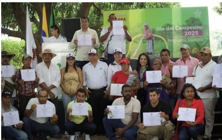
Se anunció la apertura de una convocatoria para Instructor Campesino a través de la agencia pública de Empleo.