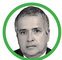
Por Rubén Darío Ceballos Mendoza