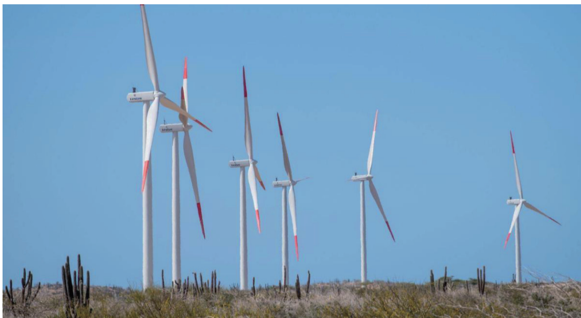
En la tercera Transición energética, la región Caribe le extiende la mano a Colombia.

Pues, ahora, cuando estamos en la tercera Transición energética, que tuvo su largada con el Acuerdo de París (1975), que tiene como propósito la descarbonización de la economía, nuevamente la región Caribe le extiende la mano a Colombia, toda vez que el mayor poten-