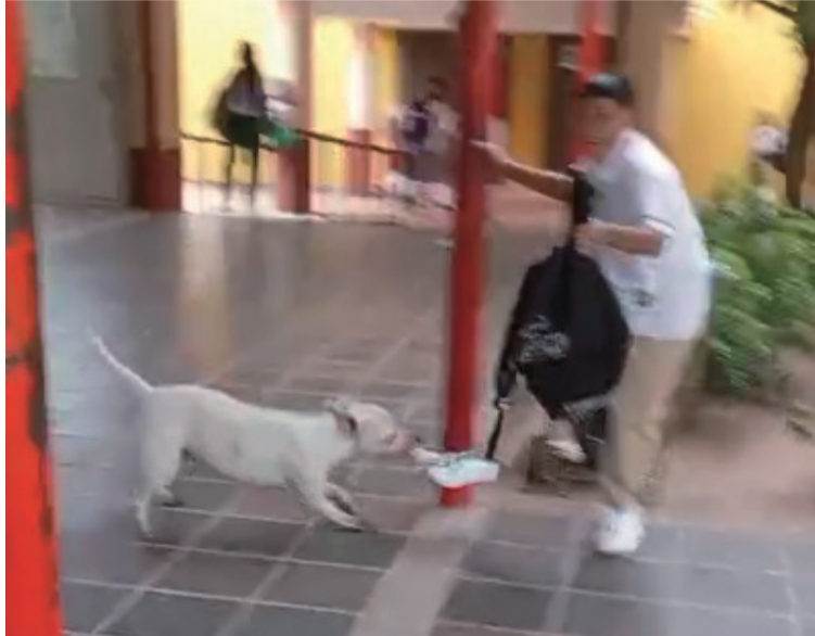
Este suceso se repitió dentro de la I.E. Roque de Alba en donde el mismo animal atacó a varios estudiantes.

Hasta el momento se desconoce el estado de salud de la estudiante y si el ataque le generó heridas de consideración. Las autoridades no han emitido