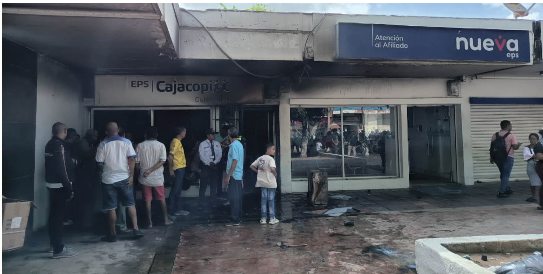
Este caso no debe terminar con una condena silenciosa, debe abrir un debate nacional sobre el colapso ético del sistema de salud.

La comunidad de Maicao no se ha quedado callada