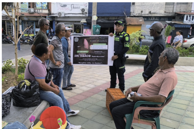
La jornada también permitió fortalecer la articulación interinstitucional en favor de la salud pública.

cadas, comerciantes y ciudadanía en general, y tuvo como propósito principal generar conciencia sobre