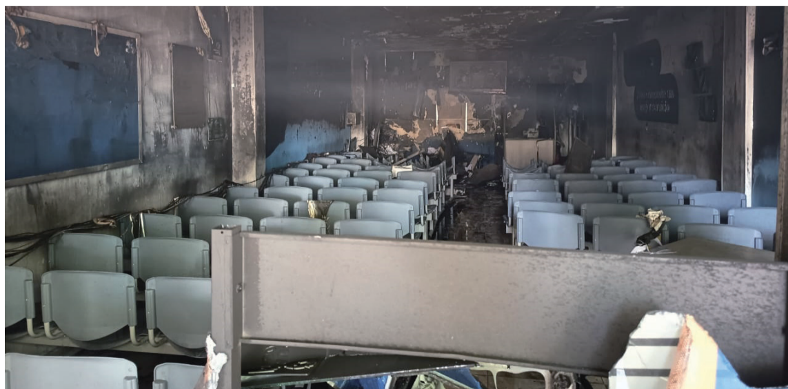
Un padre de familia decidió prender fuego a su oficina, ante la indiferencia de Cajacopi.

Desde este rincón del país, gritamos al resto de Colombia que el estallido sigue vivo, solo que ahora tiene otras formas, otras voces, otras llamas. Y mientras no se corrija la raíz de la injusticia —la indolencia institucional, la corrupción, la burocracia criminal, la desprotección sistemática—, estos estallidos seguirán ocurriendo. Un día será una oficina. Otro día, será un hospital. Otro, una escuela. Porque lo que está en juego no es solo un servicio, es la dignidad misma de vivir en este país.