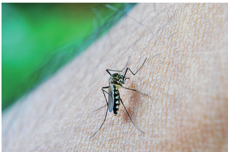
La Secretaría de Salud Dptal hizo entrega de toldillos impregnados con insecticidas en los municipios priorizados.

Para atender la emergencia sanitaria nacional, la Secretaría realizó asistencias técnicas, a través de capacitaciones y estudios de caso, en los municipios de El Molino, Dibulla y Barrancas, con la participación del Grupo Funcional de ETV y Zoonosis, mé-