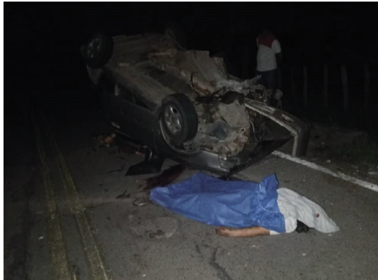
El cadáver de la mujer extranjera fue llevado hasta la morgue para practicarle la necropsia correspondiente.