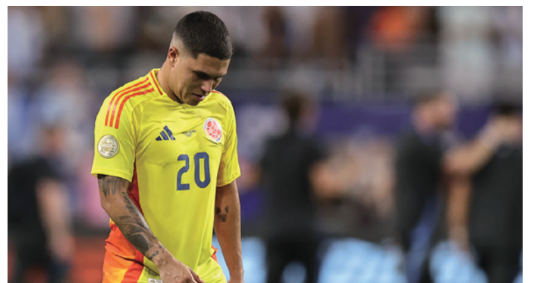
La FCF no ha anunciado un reemplazo para el país, lo que deja al cuerpo técnico con 25 jugadores disponibles.

la Premier League con el Liverpool. El grupo realizó su primera sesión de entrenamiento en Barranquilla, enfocados en el compromiso del próximo viernes ante Perú en el estadio Metropolitano.