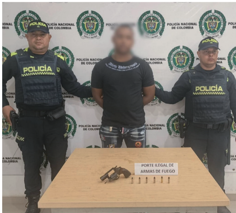
A este sujeto la policía le halló un arma de fuego tipo revólver, calibre 38, marca Colts, con su tambor cargado.

Al llegar al sitio, los uniformados procedieron a