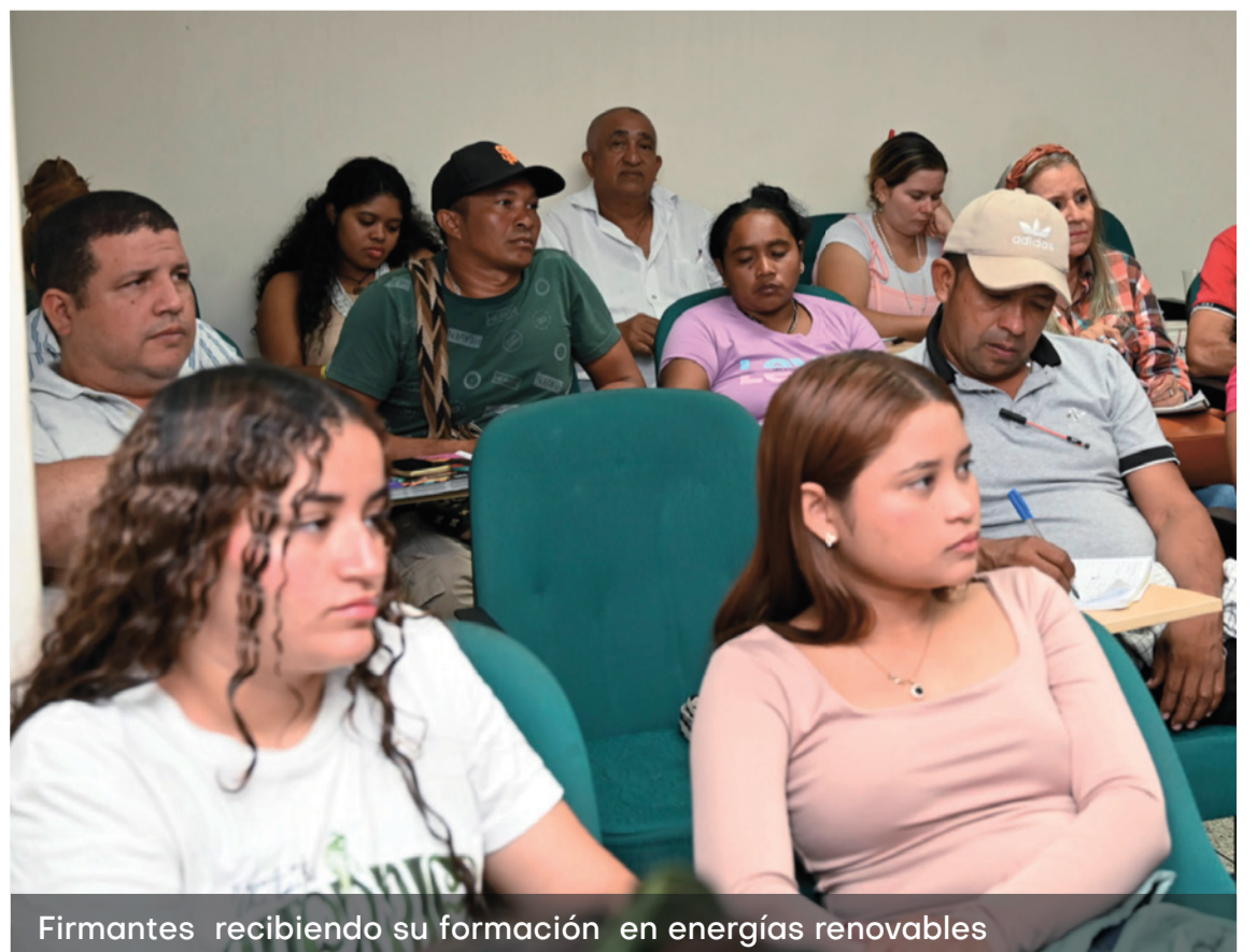
Firmantes recibiendo su formación en energías renovables

consolidación como un aliado estratégico en la transformación socioambiental de la región, la capacitación de agentes de cambio y el afianzamiento de su compromiso con una transición hacia energías limpias y autosostenibles.