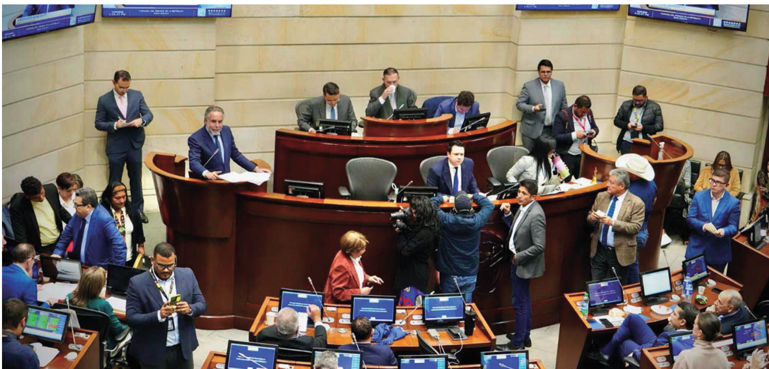
El Senado en Plenaria votó sobre los que estaban en favor o en contra de la consulta popular de manera abstracta.

Los conceptos no son decisiones, por lo tanto, no generan obligaciones de cumplimiento. Mientras la Constitución en el artículo 104 se refiere al concepto favorable del Senado, para que el presidente, con las firmas de los ministros, convoque la consulta popular; pero en la Constitución no dice lo mismo para gobernadores y alcaldes, sin embargo en la Ley 134, si incluyen el concepto favorable de Asamblea y Concejo, para departamentos y municipios.