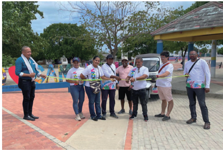
El servicio se prestará con más de media docena de motocarros eléctricos aportados por MinMinas.

En el acto de lanzamiento estuvieron como invitados especiales los emprendedores locales, la corregidora de Camarones y el exalcalde de Riohacha Rafael Ceballos Sierra.