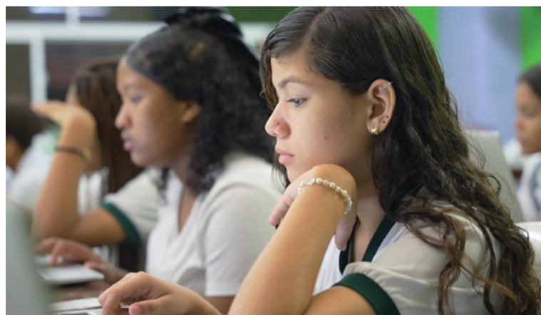
Se busca resignificar la cultura de la evaluación, potenciando tanto el ser como el saber de cada estudiante.

El proceso de aplicación se realizará en tres fases, y cada fase tendrá una ventana de dos semanas para su aplicación.