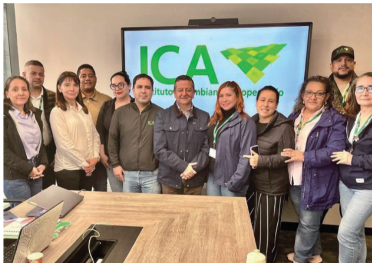
Durante las prácticas, se realizó una visita de campo a un lugar de producción y a una empacadora de vegetales.

Durante la jornada, se desarrollaron sesiones de trabajo enfocadas en la actualización de conocimientos sobre la normatividad vigente, en particular la Resolución ICA 824 de 2022, que establece los requisitos para el registro ante el ICA de los lugares de producción, exportadores y empacadoras de vegetales para la exportación en fresco. Se enfatizó en la importancia