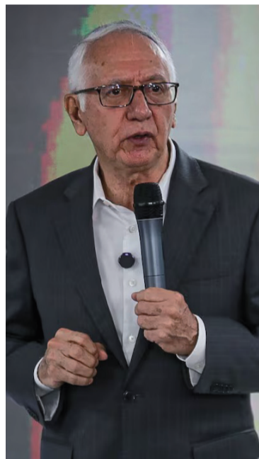
Guillermo Jaramillo, ministro de Salud.

El Tolima encabeza la lista de departamentos más afectados, con 81 casos confirmados y 30 muertes, lo que representa el epicentro del actual brote. Le siguen Huila, Cauca, Nariño, Putumayo, Caldas, Caquetá, Meta, Guaviare y Vaupés, donde también se han registrado contagios y muertes rela-