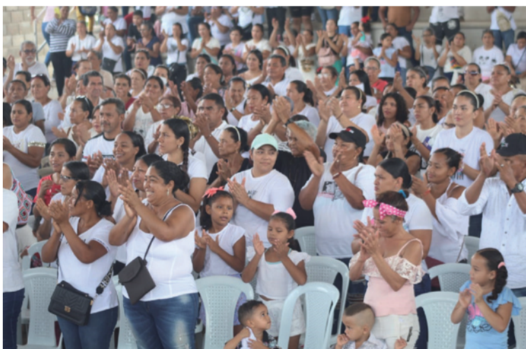
El programa 'Dona tu Plato' busca llevar alivio alimentario a familias en condición de vulnerabilidad.

El evento cerró con palabras de agradecimiento hacia el equipo de voluntarios que, desde tempranas horas de la madrugada, apoyaron la logística de esta jornada solidaria que promete impactar positivamente a muchas familias urumiteras.