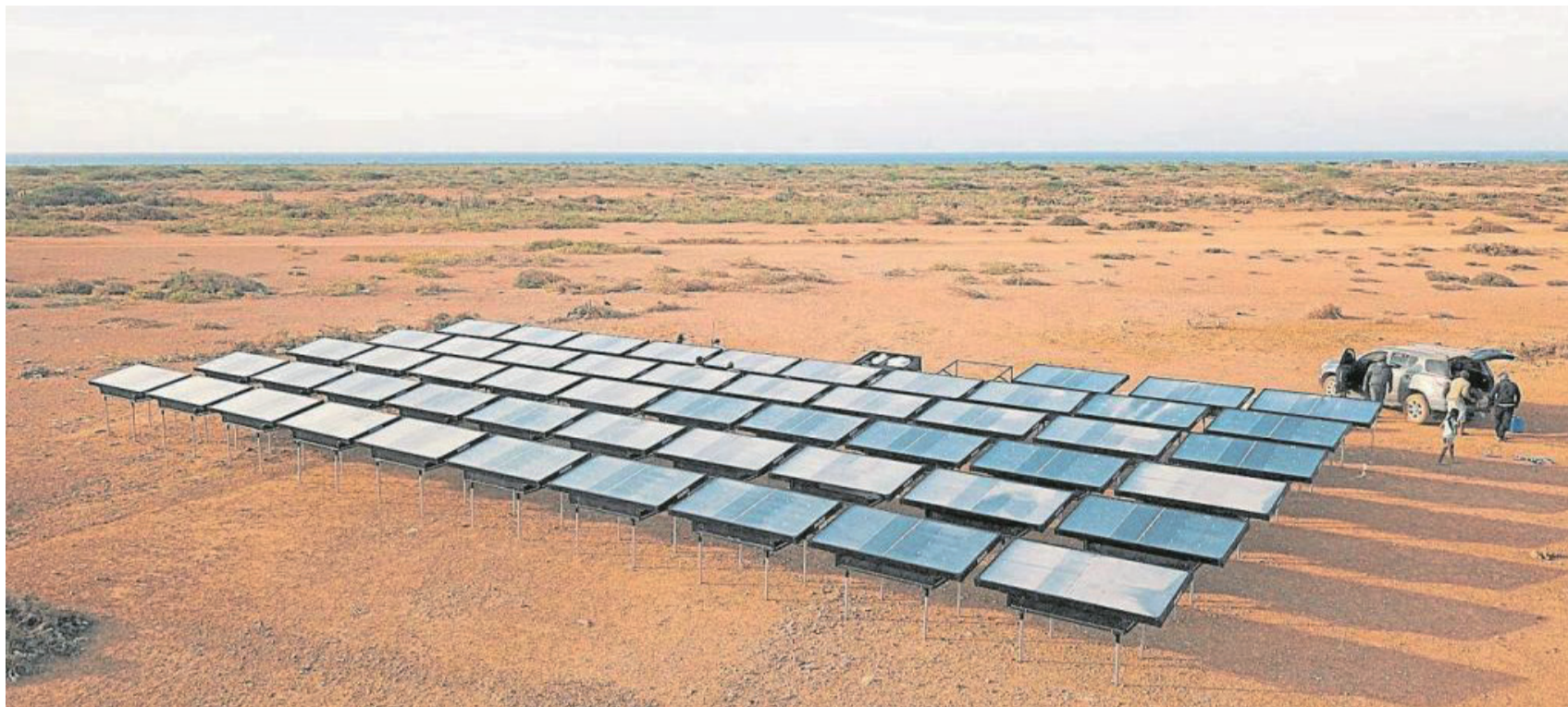
El mayor potencial de fuentes no convencionales de energías renovables, especialmente eólica, solar - fotovoltaica están en la costa.

La Guajira le tiende de nuevo la mano al resto del país