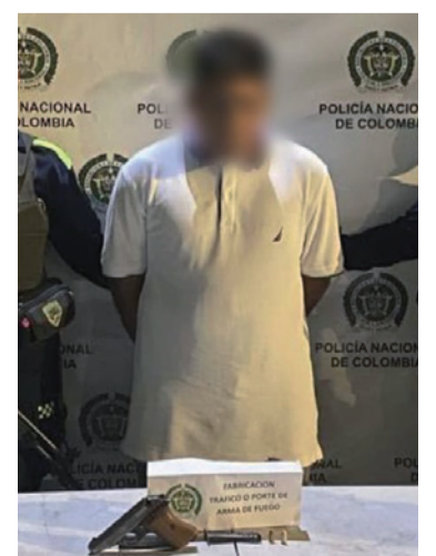
Esta persona fue capturada con arma de fuego.

Tras verificar esta situación, se procedió a materializar los derechos del ciudadano como persona capturada, siendo puesto a disposición de la autoridad competente para que responda por los delitos que se le imputan.