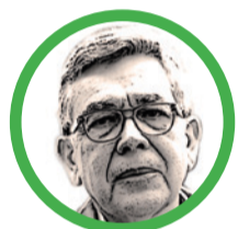
Por Normando José Suárez Fernández