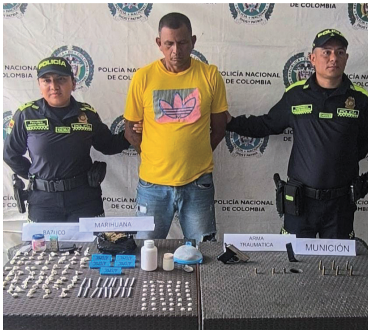
Dijeron las autoridades que alias 'El Flaco' cuenta con más de 10 anotaciones judiciales por distintos delitos.

En el marco del Plan de Ofensiva Territorial, orientado a contrarrestar los delitos de porte de armas de fuego y el tráfico de estupefacientes, la Policía Nacional propinó un nuevo y certero golpe a las estructuras dedicadas al microtráfico en el municipio de San Juan del Cesar.