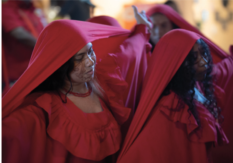
El proyecto representa un modelo de trabajo intersectorial e interinstitucional, liderado por el MinCulturas.

Esta iniciativa, con una inversión de $1.250 millones, responde a 15 metas concretas cuyo periodo de ejecución finaliza en junio de este año. Los logros de las metas se traducen en acciones y productos como la formulación de un proyecto intersectorial; la realización de capacitaciones sobre violencias basadas en género y para gestores de danza y música; mercados de economías populares y emprendimiento, así como la circulación de una