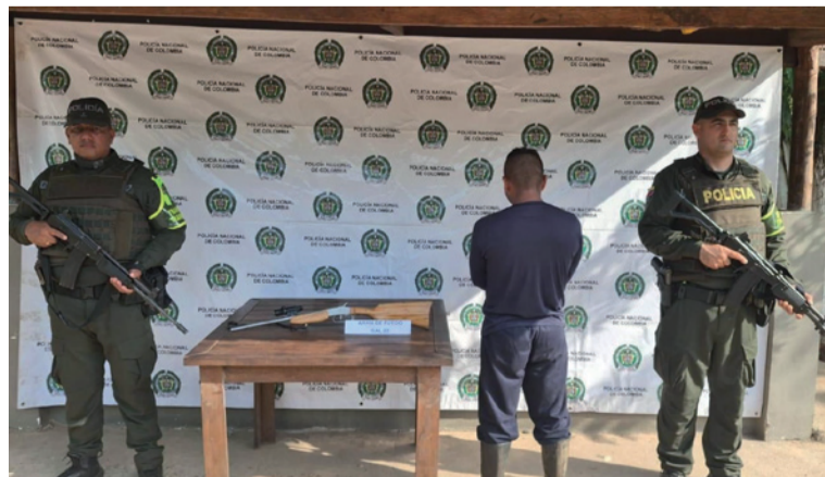
A la altura del kilómetro 23, uniformados detuvieron a un ciudadano que portaba una escopeta sin papeles.

La Policía Nacional, en desarrollo de los planes de control y seguridad vial, logró la captura en flagrancia de una persona por el delito de fabricación, tráfico, porte o tenencia de armas de fuego, accesorios, partes o municiones, en la vía que comunica a Río Palomino con Riohacha.