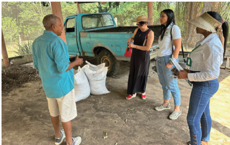
Se construyó una plantilla para desarrollar un plan de marketing digital a cada unidad productiva.

DESTACADO El proceso de capacitación permitirá al emprendedor adquirir habilidades clave en el uso de herramientas digitales, manejo de redes sociales, y atención virtual al cliente.